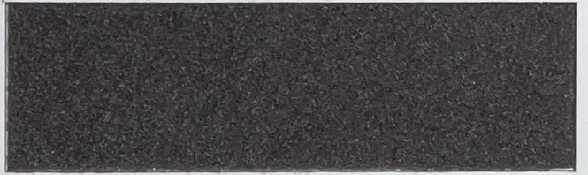
.639 Testa Di Moro • Dark Brown