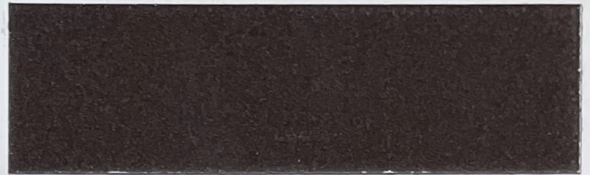
.625 Marrone • Brown