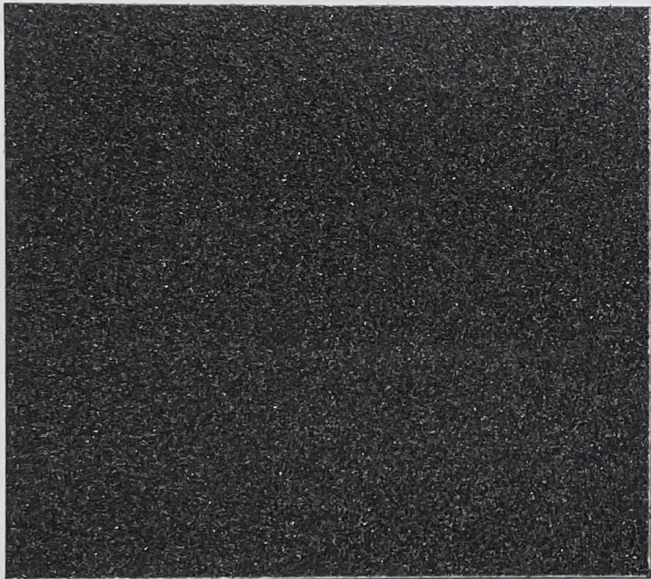
.200 BASE PURE 2