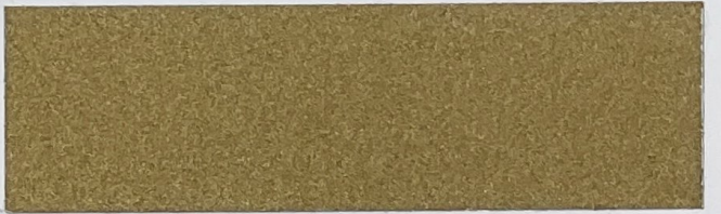
.610 Oro • Golden