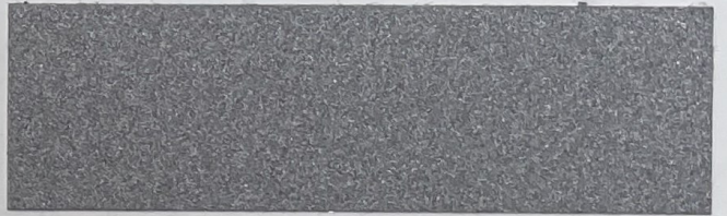
.609 Alluminio • Aluminium