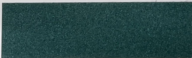
.613 Verde • Green