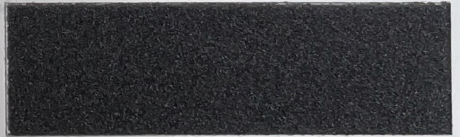
.602 Canna di Fucile • Banner