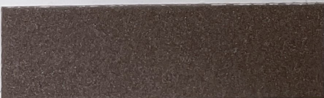
.605 Brunito • Polished