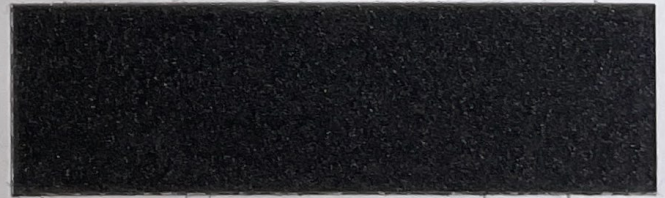
.608 Antracite (Ghisa) • Anthracite (Cast Iron)