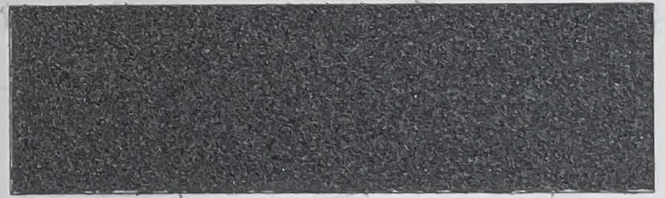
.638 Grigio Acciaio • Steel Gray