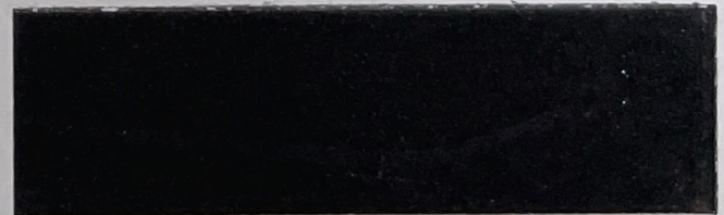
.626 Nero • Black