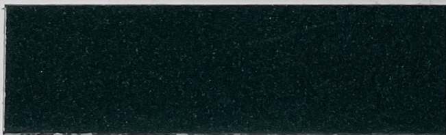
.615 Verde Scuro • Dark Green